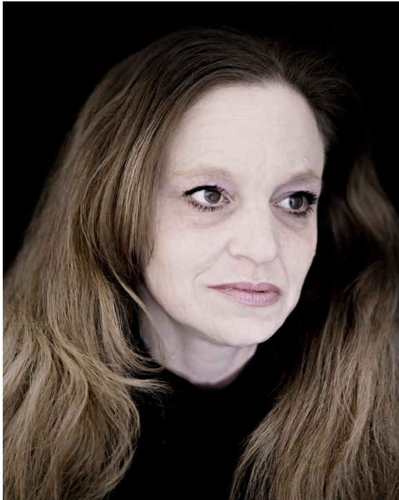
Only God Can Judge Me, 2012 - 14