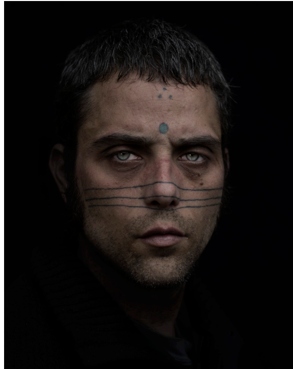
Only God Can Judge Me, 2012 - 14