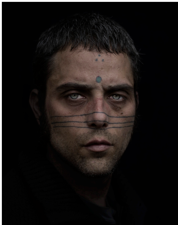
Only God Can Judge Me, 2012 - 14