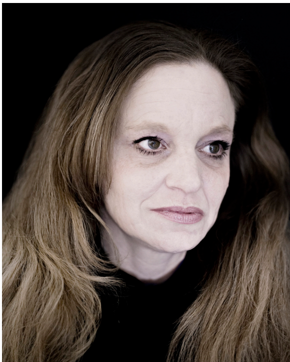
Only God Can Judge Me, 2012 - 14