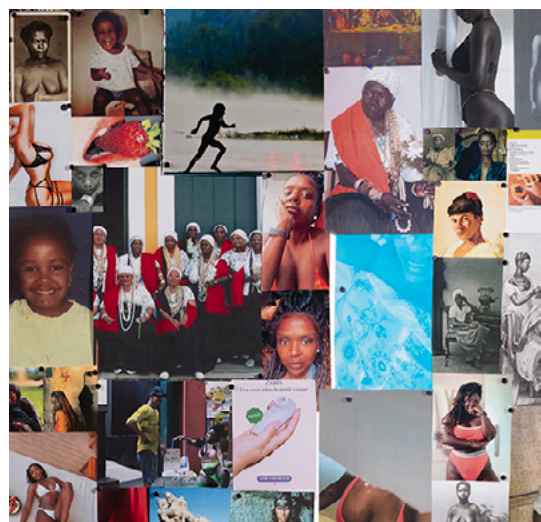
Val Souza, Vênus , (détail), Instituto Moreira Salles Collection, 2022