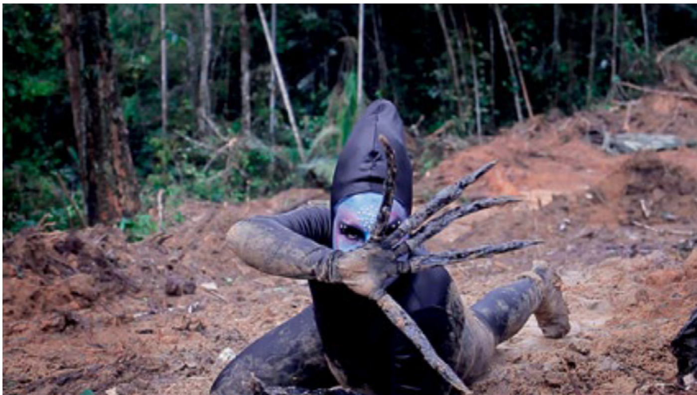
Rafa Bqueer, O nascimento, Themônias , Instituto Moreira Salles Collection 2021