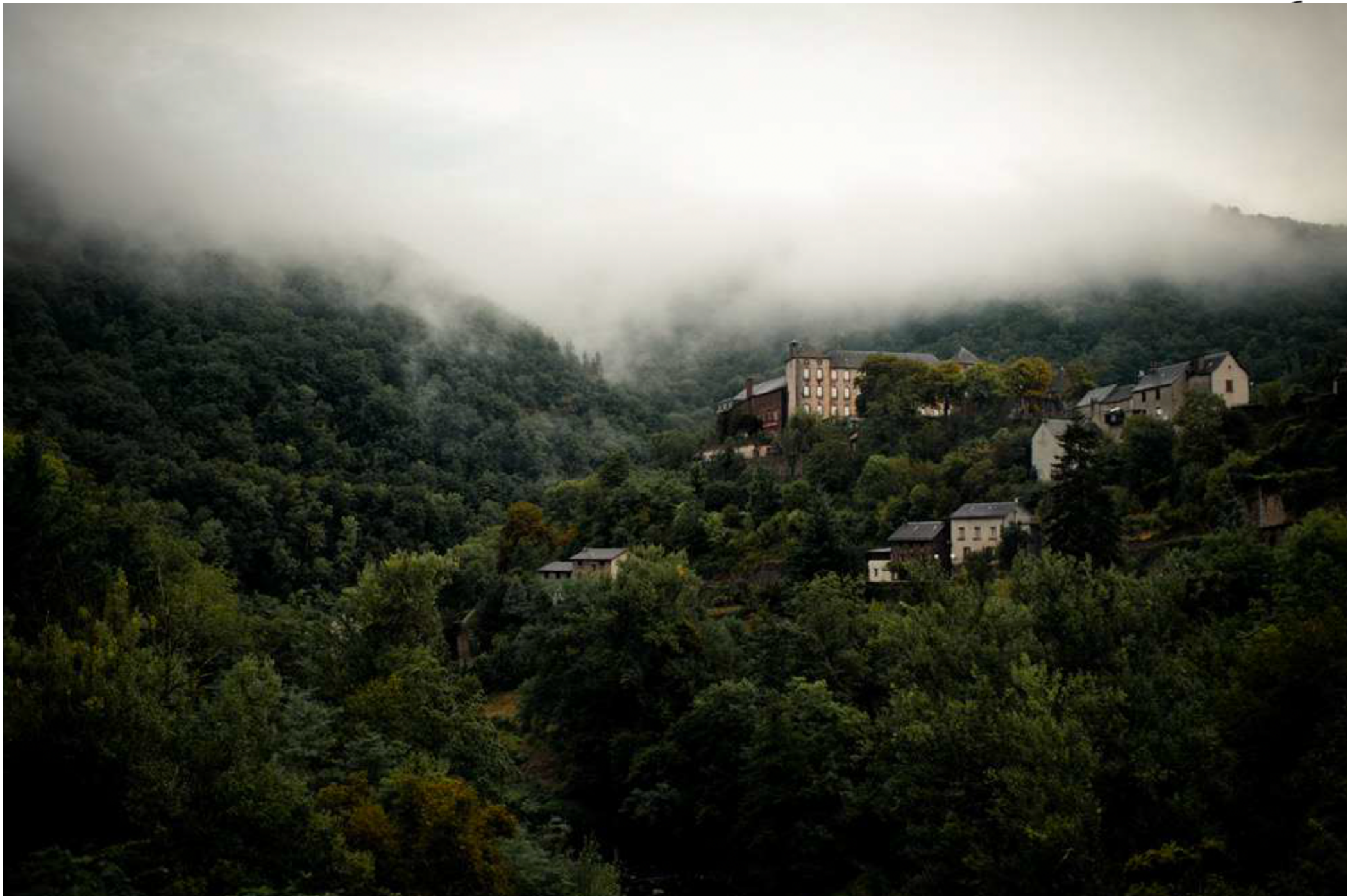
© Julien Coquentin / serie Oreille coupée