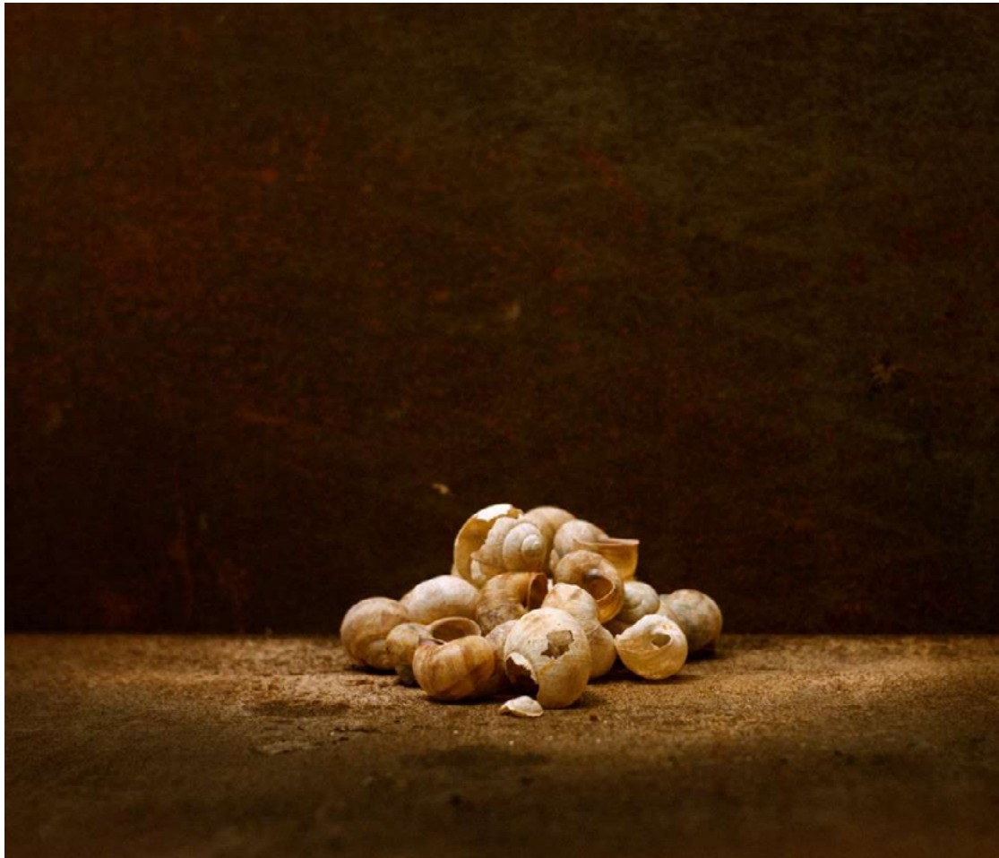
© Julien Coquentin, série saisons noires