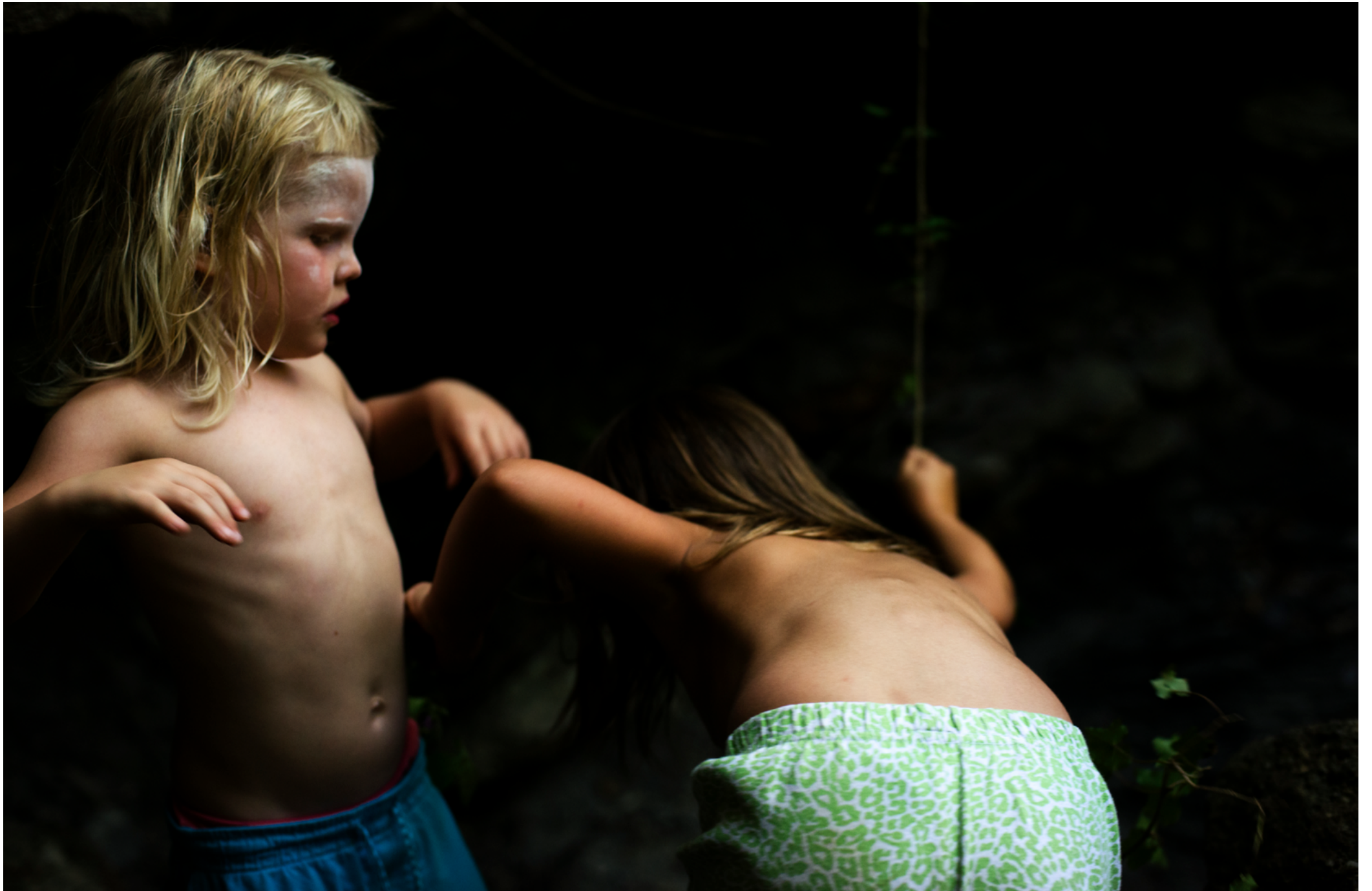
© Julien Coquentin, série saisons noires