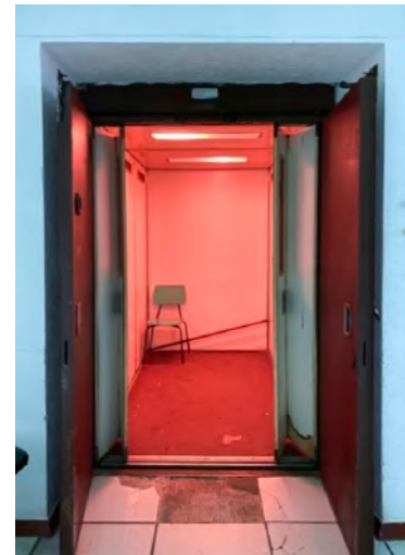
© Oksana Nevmerzhytska, série Hospital, Lost in Time , 2021

Oksana Nevmerzhytska originaire de Kiev où elle a étudié est aujourd'hui réfugiée en Pologne. Elle a étudié à l'école d'art MYPH et à l'école de photographie de Kiev. Et depuis 2019, elle se consacre à son travail artistique. Elle a reçu des prix et des distinctions lors de concours internationaux de photographie, ses œuvres ont été présentées en Europe (Ukraine, France, Grande-Bretagne, Suède, Géorgie) en Israël et aux États-Unis. Les travaux d'Oksana sont également publiés dans The British journal of photography .