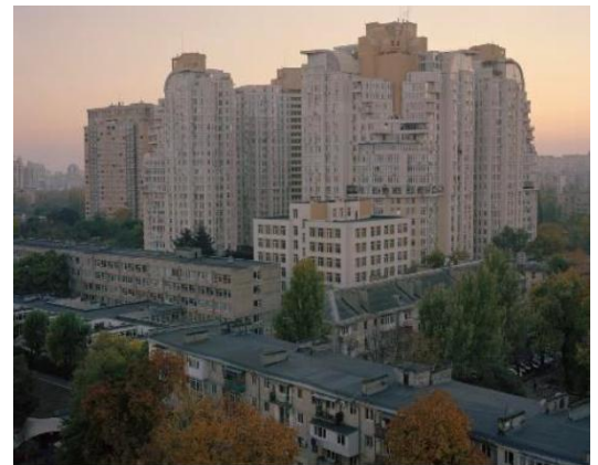
Série Temporary Homes

Daria Svertilova est une photographe née en 1996 à Odesa, en Ukraine. Elle vit et travaille entre Kiev, Odessa et Paris où elle étudie en Master à l'École des Arts Décoratifs de Paris.