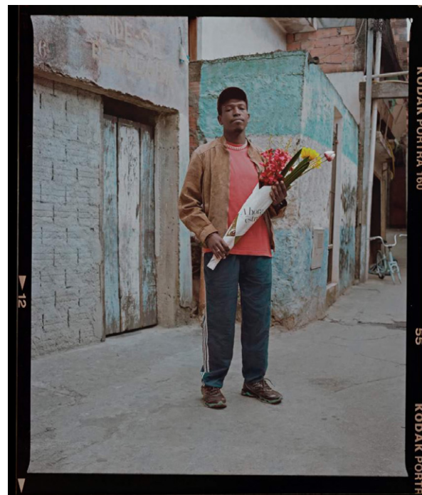
© Rogério Vieira / Somos todos alvos aqui , 2023

Dans le cadre de l'année du Brésil en France, le Centre Claude Cahun est fier de présenter la série Somos todos alvos aqui (Nous sommes tous des cibles ici) du photographe brésilien Rogério Vieira, lauréat du prix PHOTO de l'Alliance française de Rio en 2023. Ce projet montre des portraits bruts et candides qui ont pour but d'alimenter le débat sur les violences policières subies par les habitants des banlieues et des favelas du Brésil – des personnes qui, pour la plupart, ont la peau noire. Les outils et accessoires du quotidien sont utilisés comme métaphore et font référence à la mort de personnes tuées par des policiers qui ont confondu un outil avec une arme à feu. Le lundi 17 septembre 2018, Rodrigo Alexandre da Silva Serrano a été abattu par des policiers qui auraient pris son parapluie pour un fusil. Cette exposition sera présentée en partenariat avec le Musée du Château des Ducs de Bretagne entre mars et mai 2025 au CCC et dans la cours du Château.