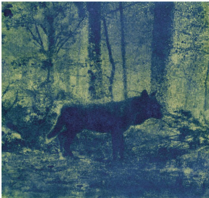
© Julien Coquentin / Oreille coupée , 2020 – 2023

Mélant les procédés argentiques et numériques, Julien Coquentin consacre sa photographie à des réalisations à mi-chemin entre le documentaire et une certaine forme d'intimité. Le travail du grain, du clair et de l'obscur confère une poésie mélancolique à ses images. Ses inspirations sont en grande partie liées à des lieux, qui suscitent des recherches, des souvenirs et des fictions.