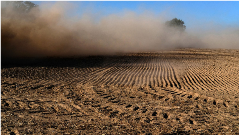
© Damien Mousseau / Odysée en terre agricole , 2022

Rencontre signature avec Damien Mousseau le 6 septembre 2025