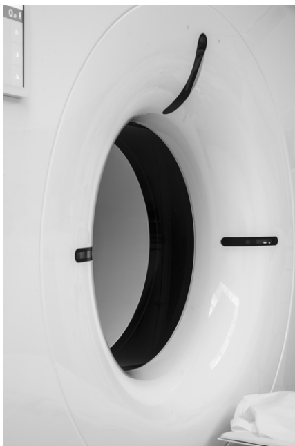
© Emma Cossée Cruz / Théâtre de machines , 2022

Résidence Drac artiste en entreprise co-production avec les ateliers Artlabs Rencontre avec Emma et performance avec l'artiste de Trempo Vidocq le jeudi 26 septembre à 19h au Centre Claude Cahun