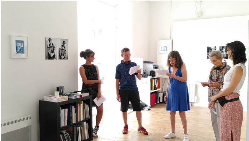
Restitution des ateliers été 2023 de la résidence Pirmil

Entre mai et septembre 2024, le Centre Claude Cahun pour la photographie contemporaine de Nantes a imaginé une exposition autour de la grande commande photographique « Radioscopie de la France : regards sur un pays traversé par la crise sanitaire », financée par le Ministère de la culture et pilotée par la BnF en 2021–2022. Cette exposition s'intitule Paysages monstrueux et regroupe quatre photographes de cette commande. Dans ce cadre, le Centre Claude Cahun développe un projet de médiation et de pratique de la photographie à destination d'un large public en lien avec des EHPAD, une maison de quartier et des foyers de remobilisation liés à la PJJ. Plusieurs cycles d'ateliers ont ainsi été conçus dans le but de proposer plusieurs approches photographiques, questionner le statut de l'image en tenant compte de ses mutations et de ses évolutions, et d'en éprouver les forces mais aussi les limites en lien avec les expositions. La restitution de ces ateliers prendra la forme d'une exposition au CCC.