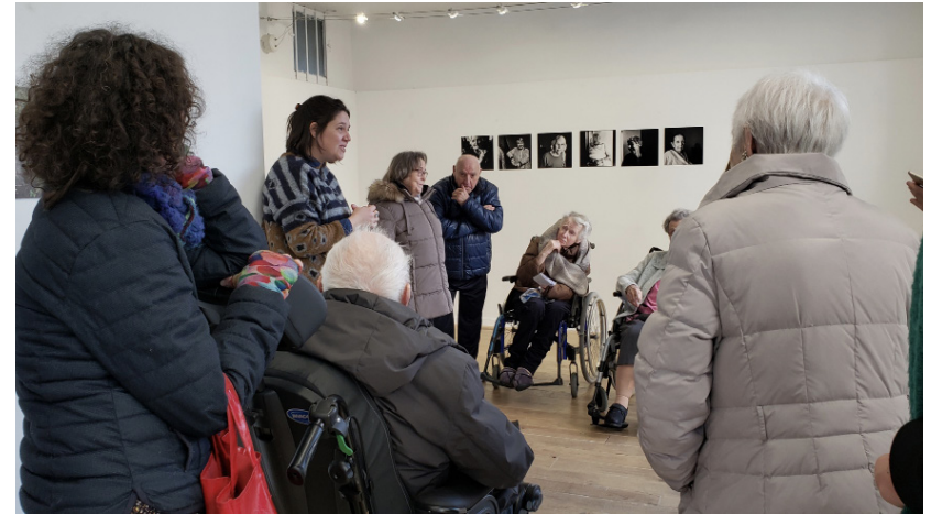
Restitution des ateliers 2021 avec l'EHPAD Richebourg

Entre mai et août 2025, le Centre Claude Cahun pour la photographie contemporaine accueillera une exposition autour du travail de Rogiero Vieira, artiste brésilien travaillant sur la discrimination raciale. Dans ce cadre, le Centre Claude Cahun développe un projet de médiation et de pratique de la photographie à destination d'un large public en lien avec des EHPAD, une maison de quartier et des foyers de remobilisation liés à la PJJ. Plusieurs cycles d'ateliers ont ainsi été conçus dans le but de proposer plusieurs approches photographiques, questionner le statut de l'image en tenant compte de ses mutations et de ses évolutions, et d'en éprouver les forces mais aussi les limites en lien avec les expositions. La restitution de ces ateliers prendra la forme d'une exposition au CCC fin août 2025.