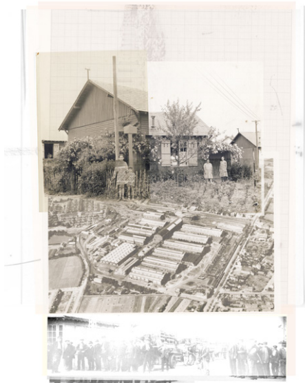
© Gaëtan Chevrier / Collage à partir des archives du quartier Haluchère-Batignolles de Nantes, 2024

Restitution de la résidence artistique de territoire « Terres photographiques » de la ville de Nantes menée par le photographe Gaëtan Chevrier et le Centre Claude Cahun