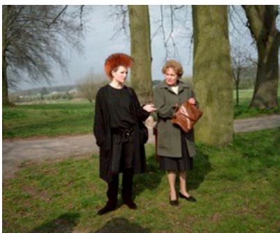
Martin Parr, A mother and daughter, série The Cost of Living, 1988

Jeff Wall, Mimic, 1982 Félix González -Torres, « Untitled », 1991