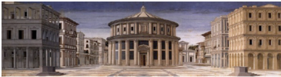
Francesco di Giorgio Martini, La Cité idéale, 1475

Louis-Jacques-Mandé Daguerre, Boulevard du temple, 1838 Mircea Cantor, Shorts Cuts, 2004