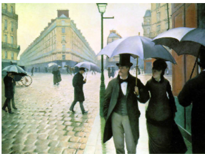
Gustave Caillebotte, Rue de Paris par temps de pluie, 1875

Lee Friedlander, New York City, 1966 Walker Evans, Subway Portrait , 1938-1941